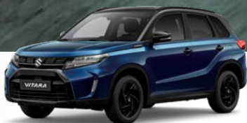
Sphere Blue Metallic x Cosmic Black Pearl Metallic