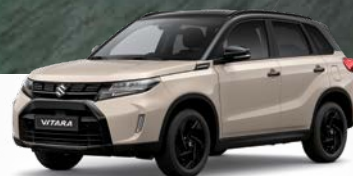
Savanna Ivory Metallic x Cosmic Black Pearl Metallic