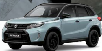
Ice Grayish Blue Metallic x Cosmic Black Pearl Metallic