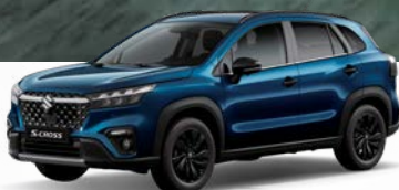
Sphere Blue Pearl