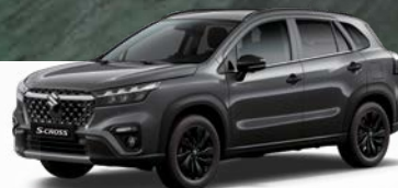
Titan Dark Gray Pearl Metallic