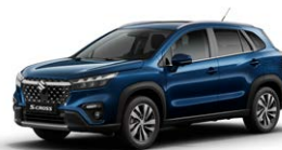
Sphere Blue Pearl