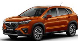
Canyon Brown Pearl Metallic