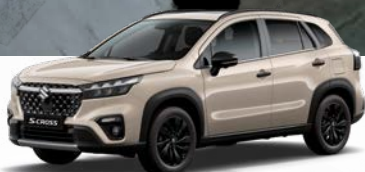
Savanna Ivory Metallic