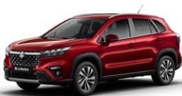
Energetic Red Pearl