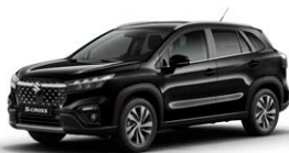
Cosmic Black Pearl Metallic